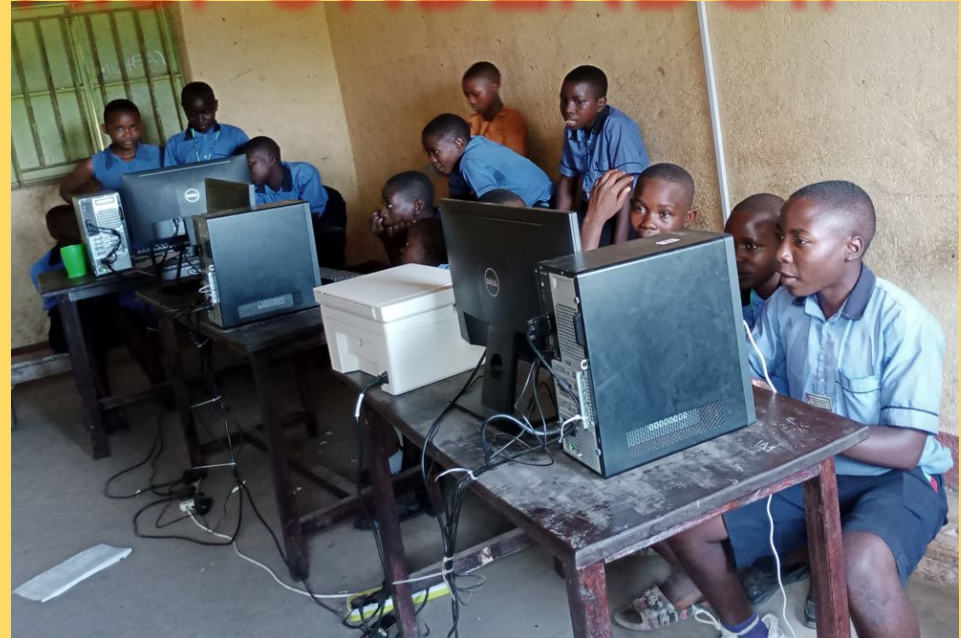
Gli alunni della classe P. 5 e P. 6 mentre stanno scrivendo le mail di risposta