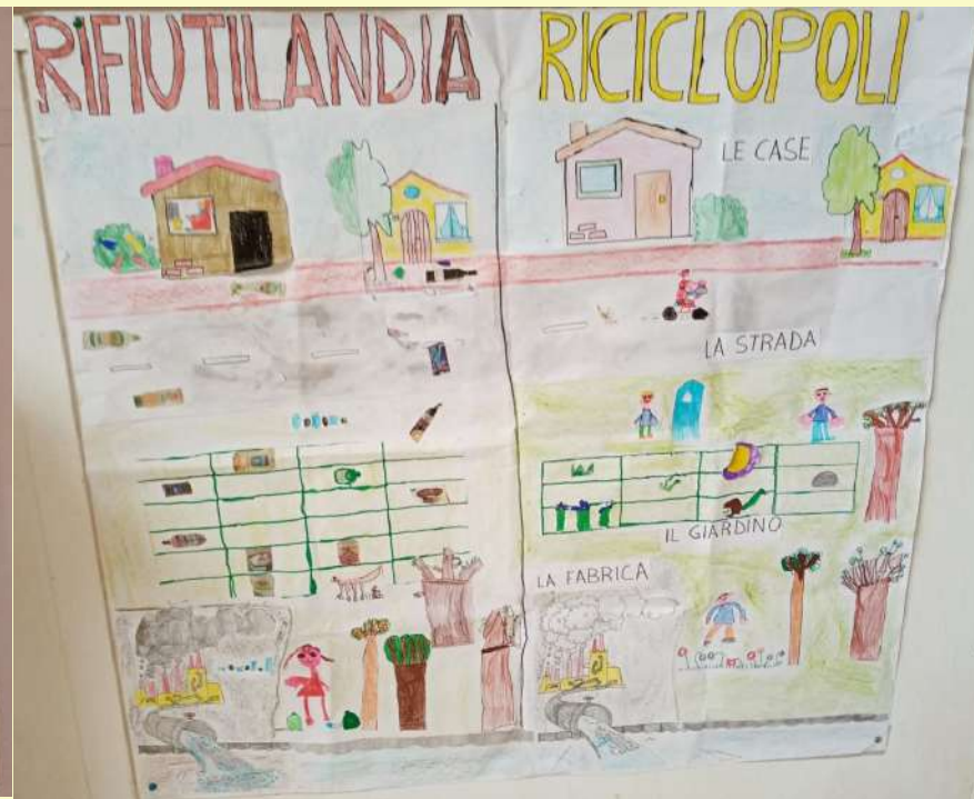
Cartelloni realizzati dai bambini