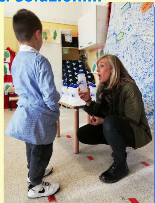
L'Assessore consegna le borracce ai bambini