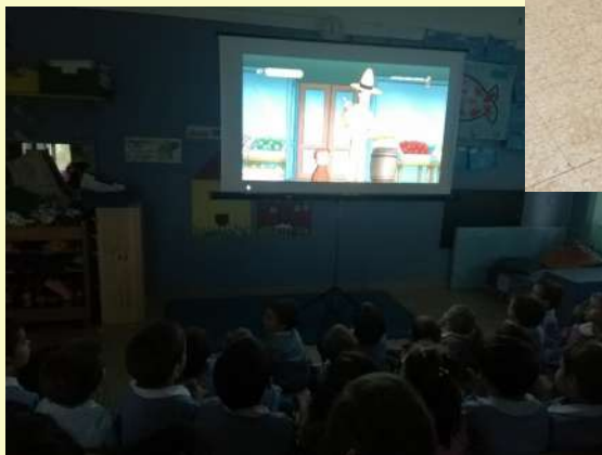
Ascolto di storie e visione di cartoni animati