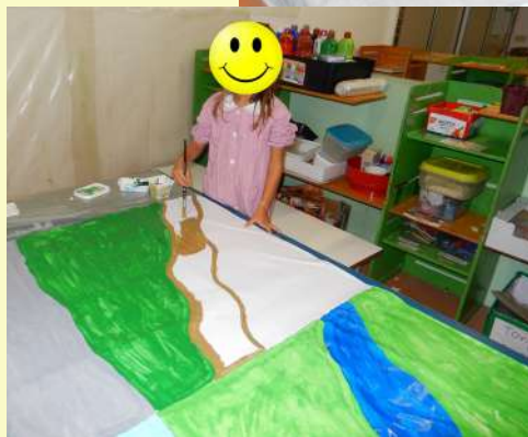
Realizzazione dei cartelloni