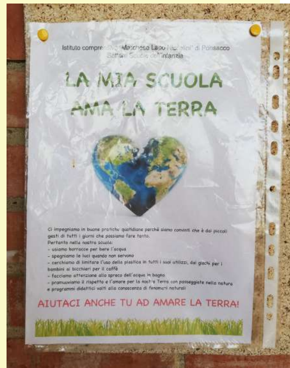
Volantino che tutte le scuola dell'infanzia dell'Istituto hanno affisso all'entrata dei plessi