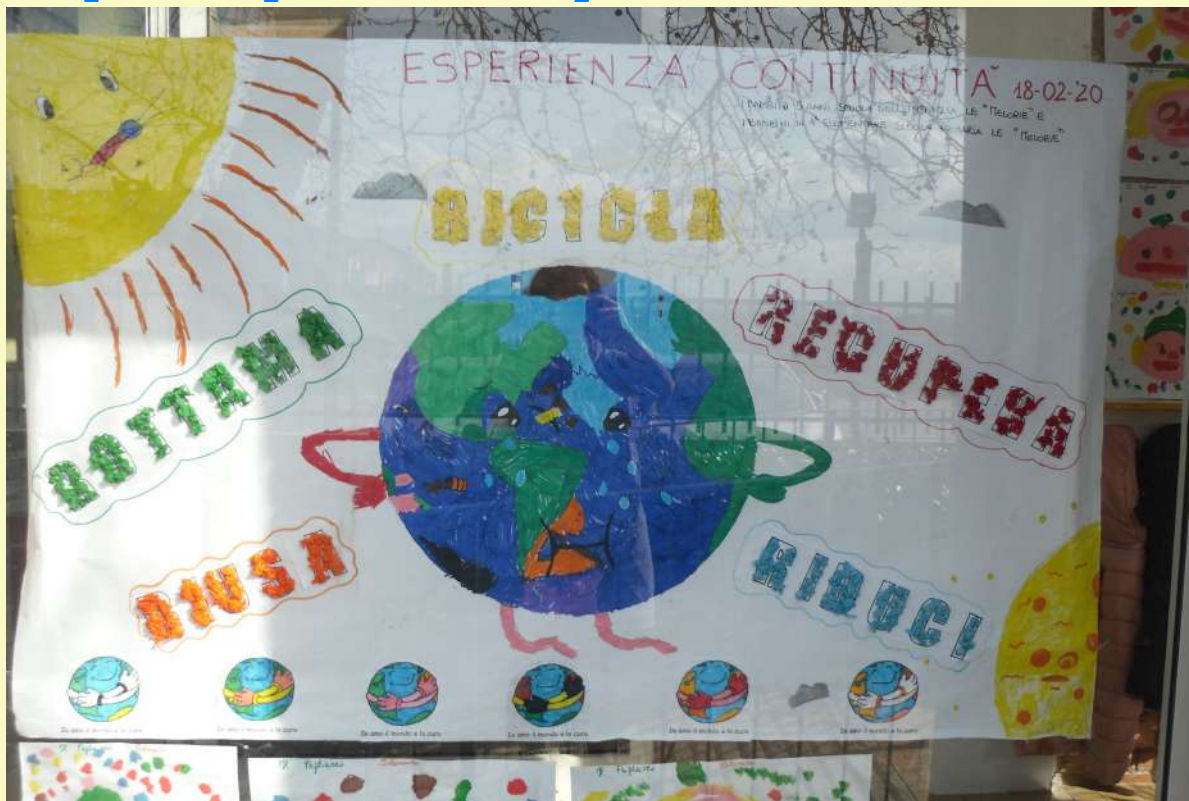
Cartelloni realizzati dai bambini